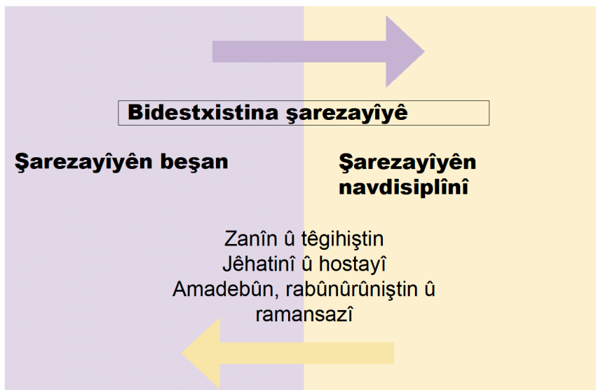
Xêzerist 1: Bidestxistina şarezayîyan (Bide ber hev. Planê Hînkirinê-21, Beşa „Têgihiştina Hînbûn û Hîndekariyê“).